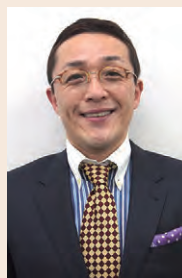
スマイリーキクチ氏